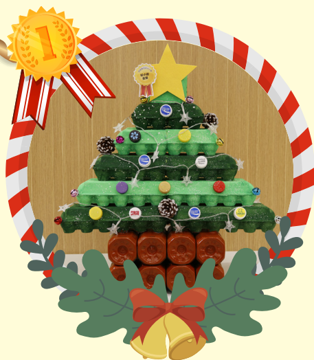
初小組金獎 -2A 曾凱樛 飄雪聖誕樹