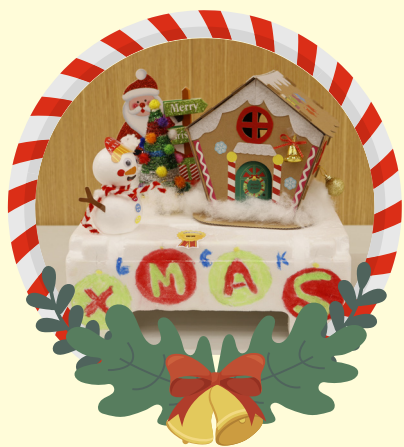
初小組優異 -3A 巫嫻妤 美麗聖誕