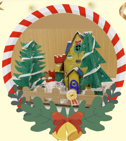
初小組優異 -1E 林頌忻 冬日聖誕小屋