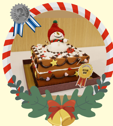
初小組銀獎 -3D 陳妙妍 奇妙聖誕