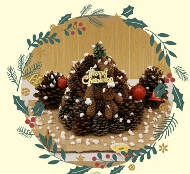
高小組優異 -5E 歐慧敏

作品： 聖誕樹與五個愉快的小孩 創作意念：這是以環保為主的聖誕裝飾，樹身是用廁紙筒做的，樹底是在行山時拿回來的，小孩是用咖啡膠囊做身體，帽子的頂是用棉花棒做的。希望在慶祝聖誕之餘也能傳達環保的重要性，讓我們享受綠色生活、綠色聖誕。