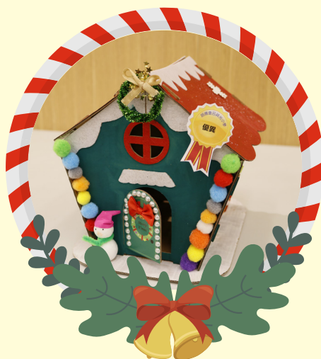
初小組優異 -2A 彭晴 環保聖誕屋