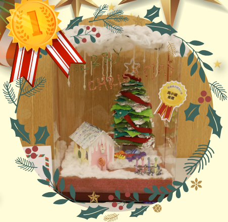
高小組金獎 -5C 楊靜汶

作品： Sweets Christmas 甜蜜聖誕 創作意念：聖誕節的時候，媽媽帶我去看燈飾，看到很漂亮的糖果屋。於是我就把它記下來製作成聖誕作品，希望可以保存我和家人的美好時光。