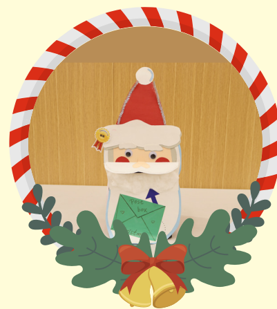
初小組優異 -3A 陳凱茵 暖心傳愛聖誕老人郵筒