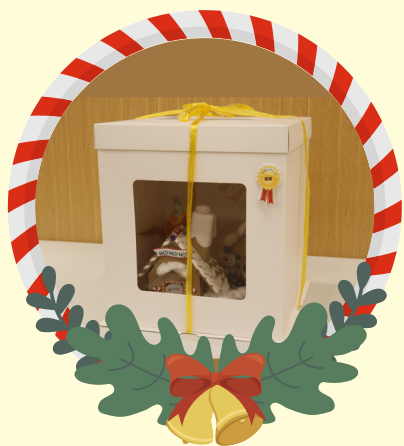
初小組優異 -3E 陳海藍 薑餅屋