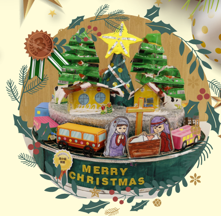
高小組銅獎 -4C 方卓翹

作品： 歡樂聖誕節 創作意念：聖誕故事裏聖誕老人總是帶着精靈朋友和麋鹿為小朋友們致送禮物，為我們帶來歡樂。將心比心，我也希望給人們帶來歡樂的聖誕老人能夠在聖誕節時和我們一起共度佳節，因此是次的創作，我設計了聖誕老人和他的好朋友：精靈、雪人、麋鹿一起在聖誕樹下過聖誕。