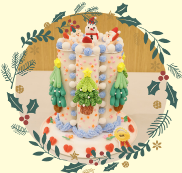
高小組優異 -4A 陳靜茹

作品： 天父快樂聖誕村 創作意念：火車比喻信主的能得到豐盛的人生，我創作這個作品是為了感謝天父將他的獨生子降臨讓，世界充滿歡欣和快樂，同時也希望我們能得到豐盛的人生。