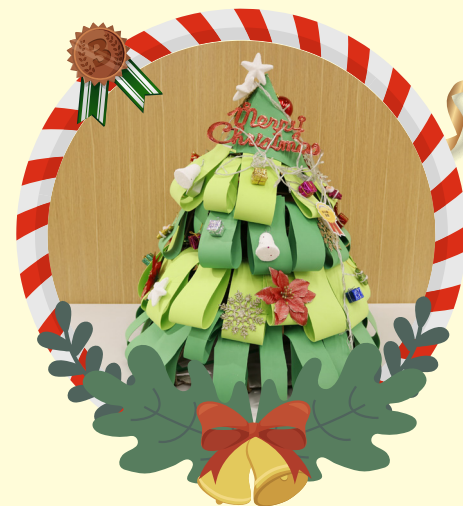
初小組銅獎 -1E 楊嘉謙 美麗的聖誕樹