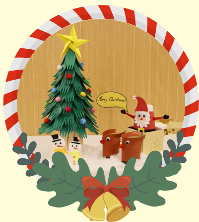
初小組優異 -3E 何鎮南 聖誕雪地