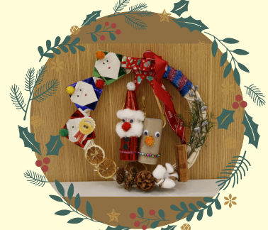
高小組優異 -4E 張浚豪

作品： 開心聖誕花環 創作意念：聖誕節時除了用聖誕樹裝飾居所、校園外，還會擺放花環慶祝這個特別日子，因此我特地製作了一個聖誕花環，祝福大家能有一個充滿歡笑的聖誕節。