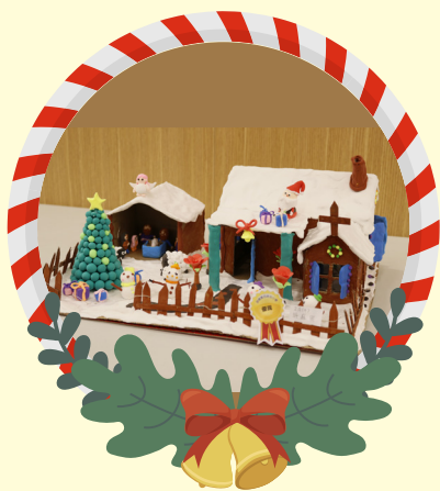
初小組優異 -2A 許庭熙 繽紛聖誕