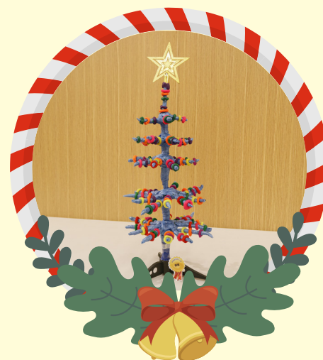
初小組優異 -2A 李晶晶 Candy Christmas Tree