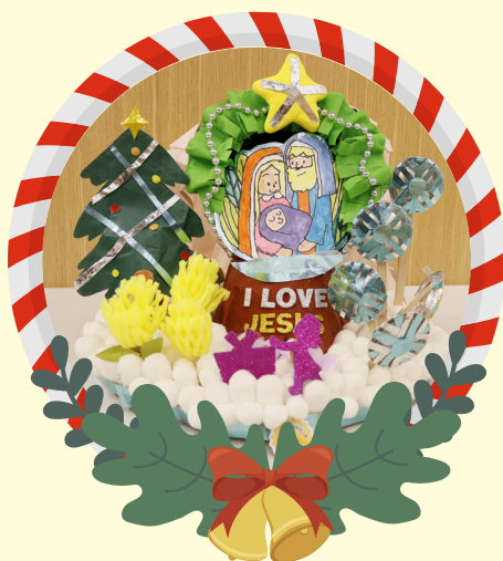
初小組優異 -1D 方卓朗 慶祝主降臨