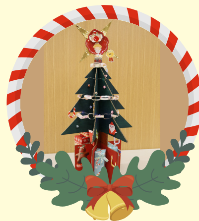
初小組優異 -1D 張文樂 七彩繽紛聖誕樹