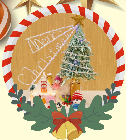
初小組優異 -1E 沈千茵 歡樂的小雪人