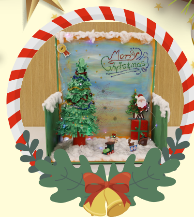
初小組優異 -3C 陳嘉謙 聖誕滿歡樂