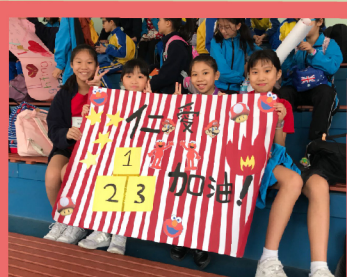
同學們高舉創意海報 在看台上為運動健兒吶喊打氣

感謝主的保守，讓校長帶領教師團隊同心合意，成功舉辦自創校以來第一個大型陸運會，培養學生堅毅、互相尊重及公平競賽的體育精神。