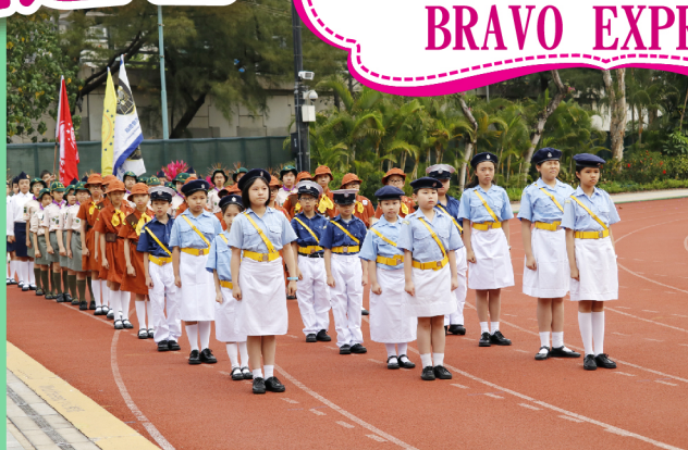
制服團體帶領持旗手及運動員代表步操進場