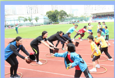
小一及小二級的「親子競技比賽」

感謝主的保守，讓校長帶領教師團隊同心合意，成功舉辦自創校以來第一個大型陸運會，培養學生堅毅、互相尊重及公平競賽的體育精神。